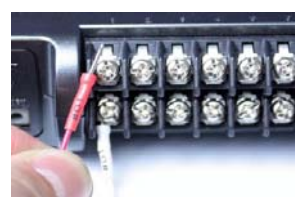
【計測機器への配線】