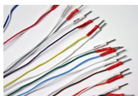
【集中ケーブル端末】